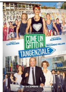
Come un gatto in tangenziale Commedia

Le preferenze devono essere al massimo 4.