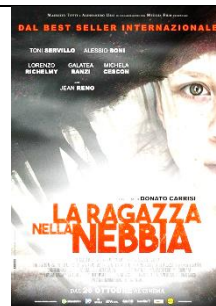
La ragazza nella nebbia Donato Carrisi - Thriller