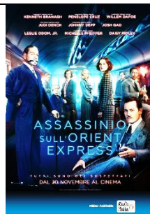
Assassinio sull'Orient Express Thriller