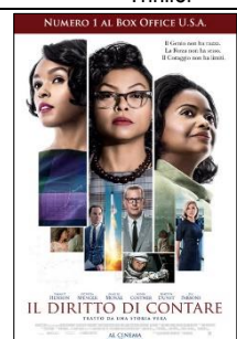
Il diritto di contare Drammatico