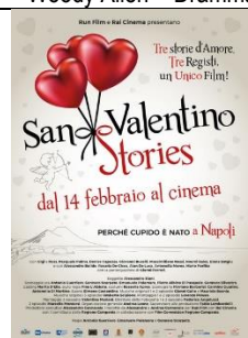
San Valentino Stories Commedia