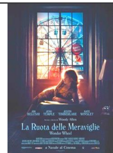
La ruota delle Meraviglie Woody Allen - Drammatico