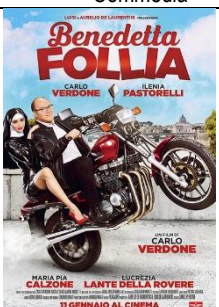
Benedetta follia Commedia